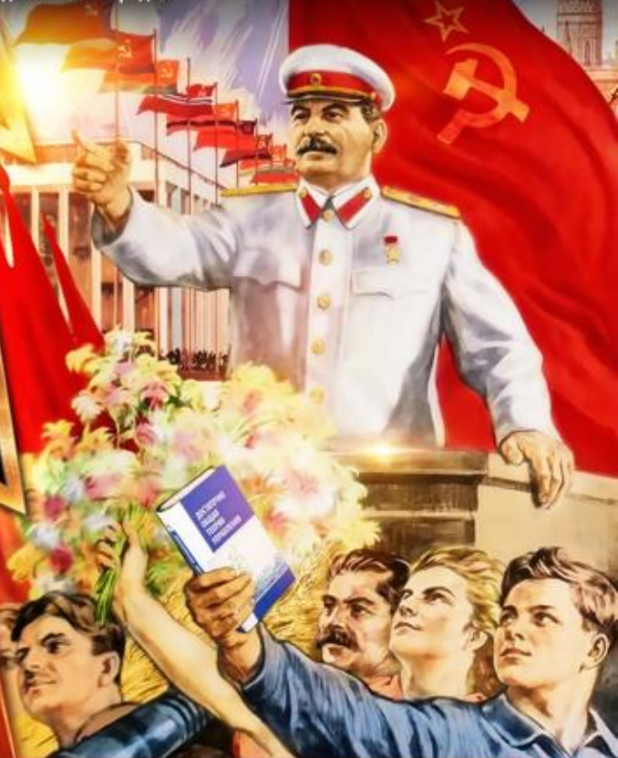
КОНСТИТУЦИЯ СССР 1936 г.